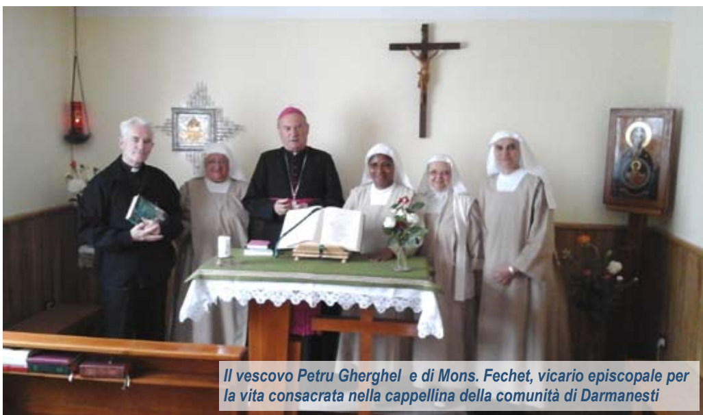
Il vescovo Petru Gherghel e di Mons. Fechet, vicario episcopale per la vita consacrata nella cappellina della comunità di Darmanesti

A giugno abbiamo avuto la visita del nostro vescovo Petru Gherghel e di Mons. Fechet, vicario episcopale per la vita consacrata. Mi permetto qui di allungare il discorso perché è stato decisamente un evento importante per la nostra piccola comunità. Con una semplice telefonata la sera prima abbiamo appreso il desiderio del Vescovo di farci visita: puntualissimo alle 8 la mattina seguente intonava l'inno delle lodi nella nostra cappellina e dopo una buona colazione, ha visitato la casa, chiedendoci quali attività svolgiamo e interessandosi soprattutto della nostra presenza in parrocchia, oltre che nel territorio, e della collaborazione con i sacerdoti, con il