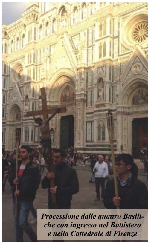
Processione dalle quattro Basiliche con ingresso nel Battistero e nella Cattedrale di Firenze