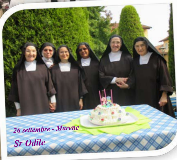
26 settembre - Marene Sr Odile