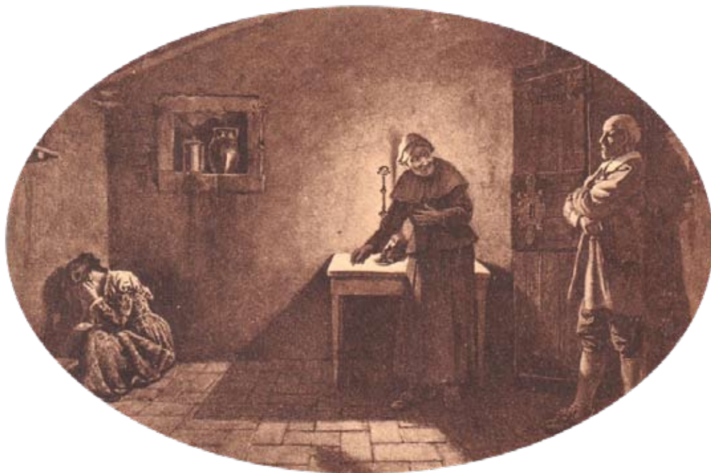
Il Nibbio, dopo aver rapito Lucia, l'accompagna presso il Castello dell'Innominato, perché vi passi la notte prima di essere condotta da don Rodrigo.

coterapeuta... Potrei riassumerla dicendo: fare delle domande, ma non domande qualsiasi: domande che cambiano uno sguardo e aiutano a dare una nuova lettura agli avvenimenti passati e presenti rivolgendosi al futuro.