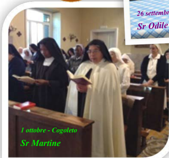
1 ottobre - Cogoleto Sr Martine