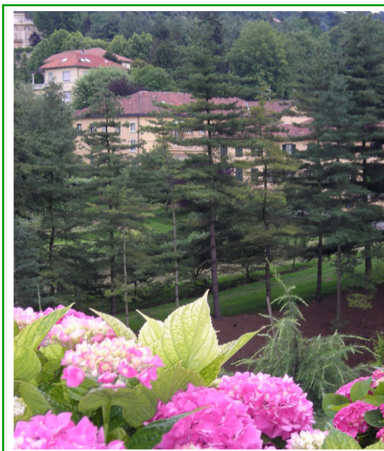
La casa di Noviziato tra i pini, vista dalle finestre di Casa Generalizia

Qui è passata dalla parola al silenzio , e provata gradatamente dalla sofferenza non si è mai udito un lamento: era dominata da una pace inalterata con un sorriso dolce che la illuminava e con uno sguardo che, per la sua profondità e la sua trasparenza, rifletteva lo sguardo di Dio... che ti purifica mentre ti guarda. Vorrei applicare a questa